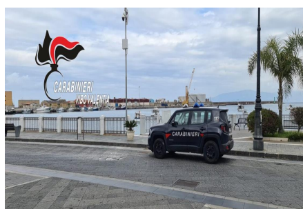
Coronavirus. Da Caulonia a