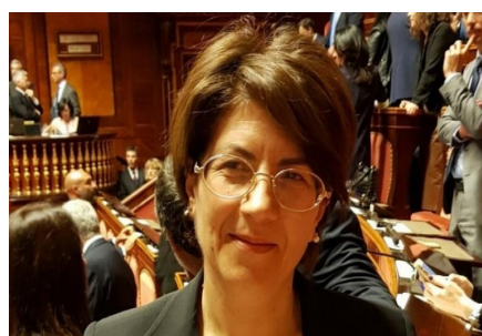
Agroalimentare. L'assessore Gallo: