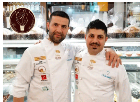
Regalati e regala il panettone dei Fratelli Rizzo

“Essere oggi accanto agli anziani – prosegue Ferri – persone vulnerabili ma straordinariamente adattive alle avversità, attraverso il numero verde 'emergenza solitudine', dona un nuovo senso alla nostra mission associativa . Un sincero ringraziamento va ai 108 nostri volontari che rispondono al centralino: alleviare la solitudine, aiutare a fare chiarezza nella confusione emotiva di questo momento delicato, stimolando anche l'attivazione delle risorse personali, sono solo alcune delle azioni messe in atto per